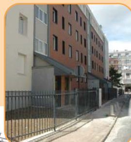
Les Vergers place Emile Zola