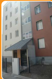
Les Vergers place Emile Zola

Réhabilitation de l'Abeille dans le cadre d'une Opération programmée d'amélioration de l'habitat. Travaux terminés depuis le début de l'année