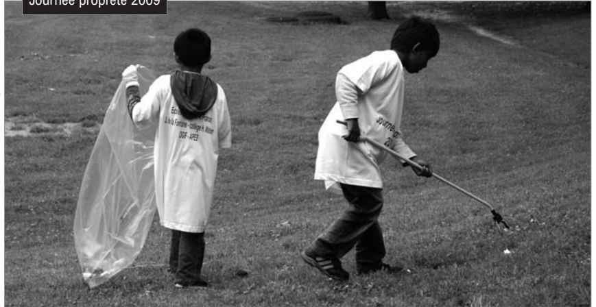
Journée propreté 2009

6 m 3 de déchets et 150 sacs sont ramassés chaque week-end (hors collecte de déchets ménagers et d'encombrants).