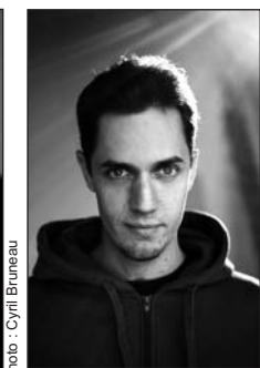
Grand Corps Malade