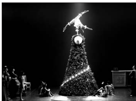
Casse-noisette « made in China »