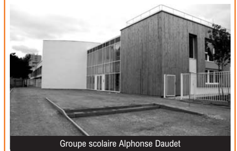
Groupe scolaire Alphonse Daudet

- L'accueil de loisirs Charles Perrault, situé au cœur de ces groupes scolaires, peut recevoir 80 enfants.