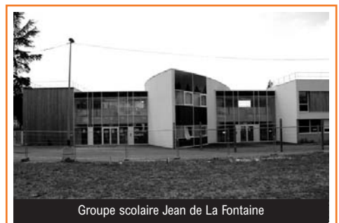
Groupe scolaire Jean de La Fontaine