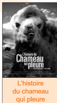
L'histoire du chameau qui pleure

Swing et jazz manouche - Entrée libre sur réservation (obligatoire)