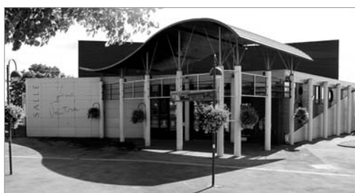
L'Espace Lino Ventura (ci-dessus)