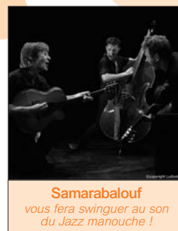
Samarabalouf vous fera swinguer au son du Jazz manouche !