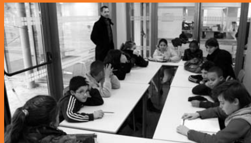
Les enfants lors de l'atelier « écriture » à la façon « dessine-moi une histoire, je te raconterais ton dessin »

Ces actions ont été soutenues par la fondation ADP, la région Île-de-France, la DDSC (Direction Départementale de la Cohésion Sociale) et le Ministère de la culture.