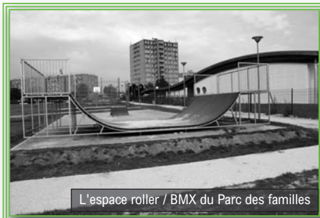
L'espace roller / BMX du Parc des familles

Le système d'arrosage automatique permet de limiter le coût des interventions, il est utilisé la nuit et arrose de manière homogène grâce à un disperser.