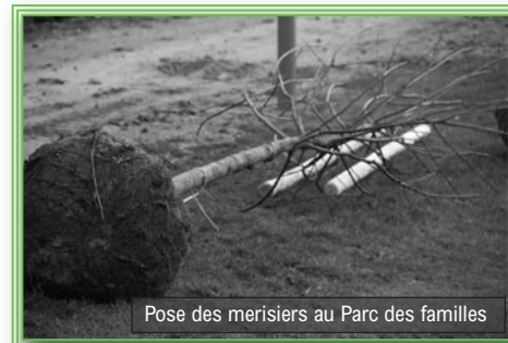
Pose des merisiers au Parc des familles