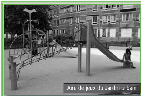
Aire de jeux du Jardin urbain