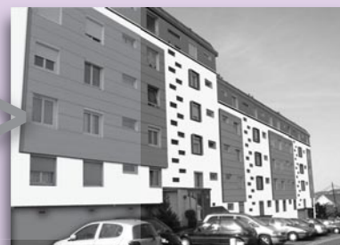
Illustration non contractuelle Crédit : bureau d'étude BETIR

Depuis le 8 mars, votre TV diffuse en tout numérique !