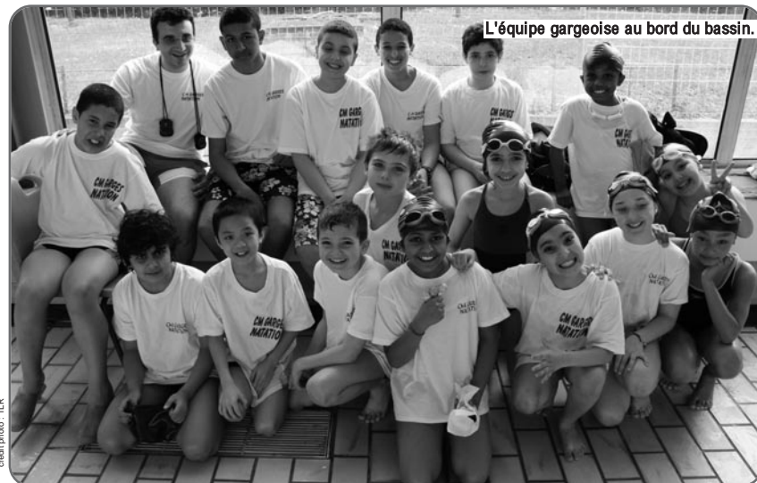
L'équipe gargeoise au bord du bassin.

Le week-end du 26 et 27 mars, 350 jeunes de 7 à 17 ans, venus de plusieurs régions de France, ont défendu les couleurs de leur club sur tous les types de nages, de 50 à 100 m.