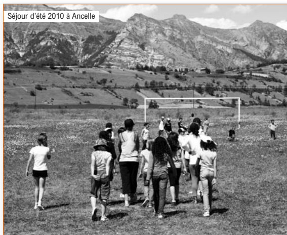
Séjour d'été 2010 à Ancelle