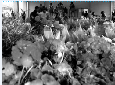
Lors de la dernière édition du Marché d'ici et d'Ailleurs de Garges-lès... Boubous !

Semaine culturelle organisée par la Direction de l'action culturelle et de l'animation urbaine.