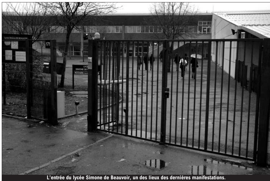
L'entrée du lycée Simone de Beauvoir, un des lieux des dernières manifestations.

Dans le cadre du mouvement lycéen en marge de la réforme des retraites, la municipalité a reporté et annulé certaines manifestations de la Quinzaine de la Citoyenneté. Retour sur ces faits d'actualité du mois d'octobre.