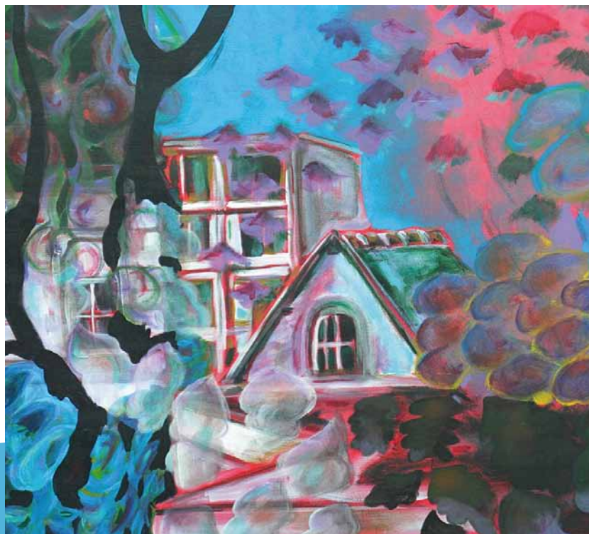
© EMAP - Peinture de Marie-Anne Pasquet

Maison des villes, maison des rêves, maison des champs, maison des arts