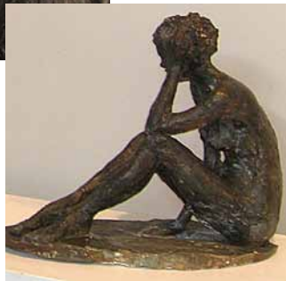
Ces photos sont extraites de la Biennale 2008.