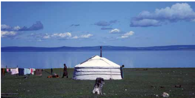
PHOTO / RÉCIT DE VOYAGE Ballades mongoles