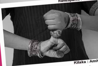
Kilaka : Amitié